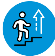
Starker interner Arbeitsmarkt